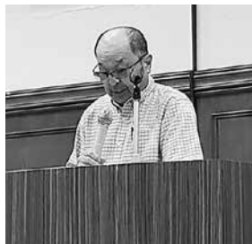
報告する栗野仕事対策部長

7月23・24日(日・月)に多摩西ブロック常任以上の1泊研修会を行いました。研修会では、本部小番書記長から若手世代と繋がり役員体制を確立する組織作りについて、本部北川書記次長からは、東京土建の産業対策の方向性と展望について学び、改めて組織・産業対策の運動の必要性を再確認しました。