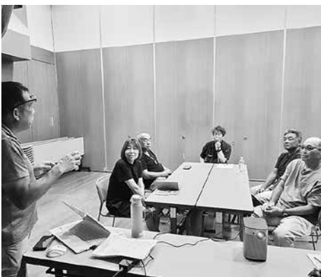
7月22日塗装防水交流会の様子