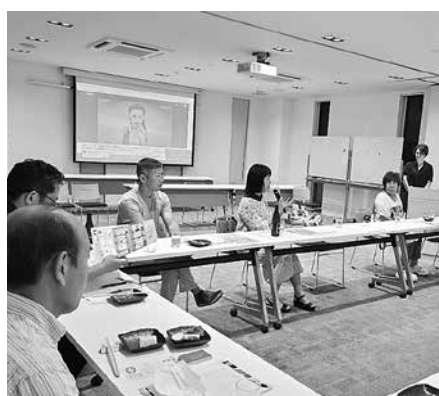
7月15日大工・タイル交流会の様子

仕事対策部では、『職種別交流会』と称して職種ごとの交流会を企画しています。業種ごとの悩みや仕事の繋がり、組合を活用していなかった仲間に組合を知ってもらうきっかけとなるのが目的となります。