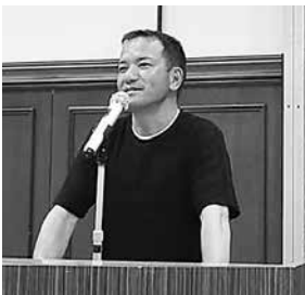
報告する木下組織部長