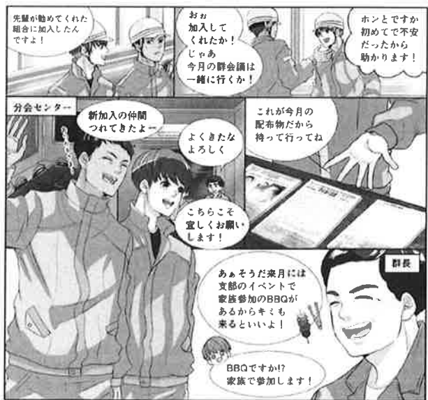
現在公開中のマンガ一例

今後はこの YouTube チャンネルを見て貰えば多摩西部支部の全貌が丸わかりとなるよう様々な動画をアッ プしていく予定なので、チャンネル登録をお願いします!