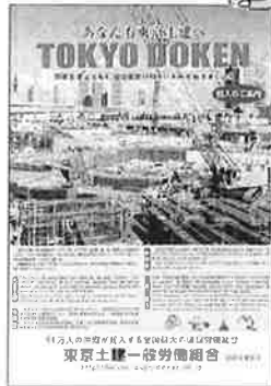
▲新しいパンフレットはこれ。組合未加入者に渡して組合の魅力を伝えよう

6月から8月は夏の拡大月間として2つの方針を重点として取り組みます。1点目は、春の月間から継続した取り組みとしてYouTubeによる土建のメリットと、困ったときは東京土建に！を広げる活動と同時に、秋や年末に向けた仲間の結集や対象者の掘り起こしに向けた対話行動（インターホン越しや電話連絡）を行います。国の各種給付金について自分には関係ないとあきらめている仲間は多くいると予想されます。普段顔を合わさない仲間を中心に声掛け活動を行いましょう。2点目は本部作成チラシの個別配布をおこなっていきます。「地域住民」「建設業従業者」それぞれに対応したチラシとなっていますので、地域に東京土建をアピールしていきましょう。2つの訪問重点をきっかけに夏の月間目標を達成し10年連続実増に向けて団結しましょう。