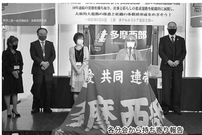
各分会から持ち寄り報告