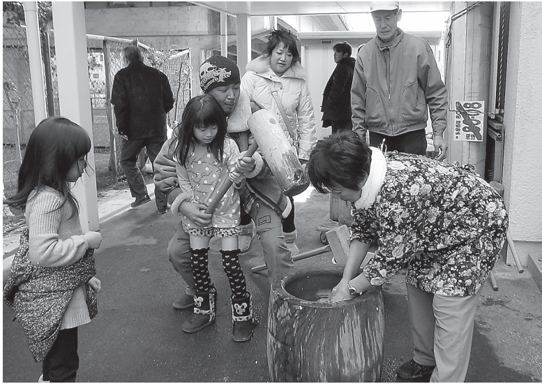
1月26日の「新春もちつき大会」には300人が参加。もちつき体験ができる貴重な機会となっています

1月26日(日)に支部会館ヨコの広場で新春もちつき大会を開催しました。組合員と家族182人に加え地域の方12人の参加で、当日は合計300人の来場となり大盛況。仲間の交流以外に日頃、お世話になっている地域の方への還元事業としても機能しています。後継者対策部を中心に取