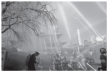
平成26年で60回目を迎える

1月23日に増上寺で行なわれた文化財防火デーの消防演習を見に行きました。先人たちが残した文化財を火災から守ろうと昭和30年から始まり、今回で60回目を迎えます。当日は天候もよく静穏のため寒さを感じることありませんでした。ほぼ毎日、乾燥注意報が出て、あちこちで火災が発生しています。文化財を後世に残すためにも普段からの心構えが大切だと思いました。このあと、久し