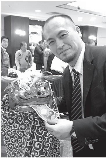
縁起の良い獅子舞が会場をねり歩く

用のお餅については市内の和菓子屋さんに製造を委託することにして、安定供給と衛生面を確保することに成功しました。またファミリーカード提携店からビールサーバーを導入するなど実験的な取組が行なわれたのが特徴です。