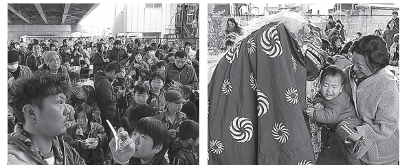
ビンゴ当選を確認する戸田後継者対策部長(左写真左)