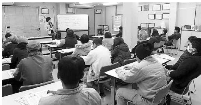
多数の参加者で基本から学習しました

確定申告に向けた税金学習会が1月25日~28日にかけて行われました。社会保険未加入問題など、建設業にかかわるさまざまな問題により独立する方も増える中、連日昨年を上回る参加者でした。