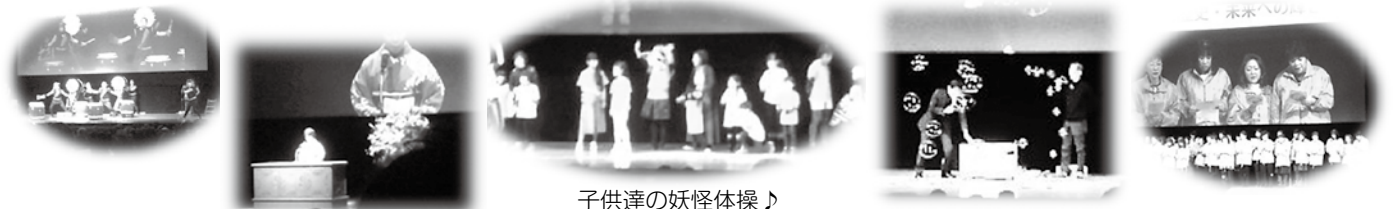
子供達の妖怪体操♪