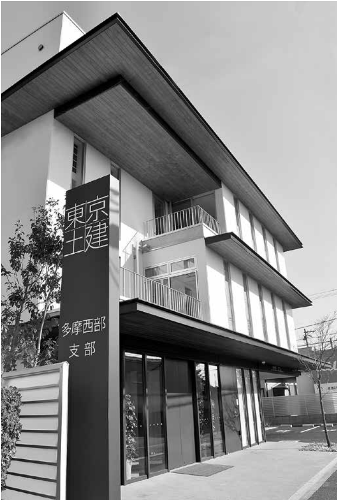
東京土建多摩西部支部 新会館