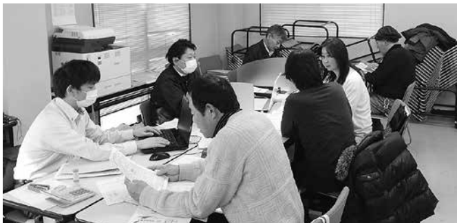
3・11集団申告に向けた税金相談で来所した多くの相談者に加入者紹介を訴え、アンケートを実施